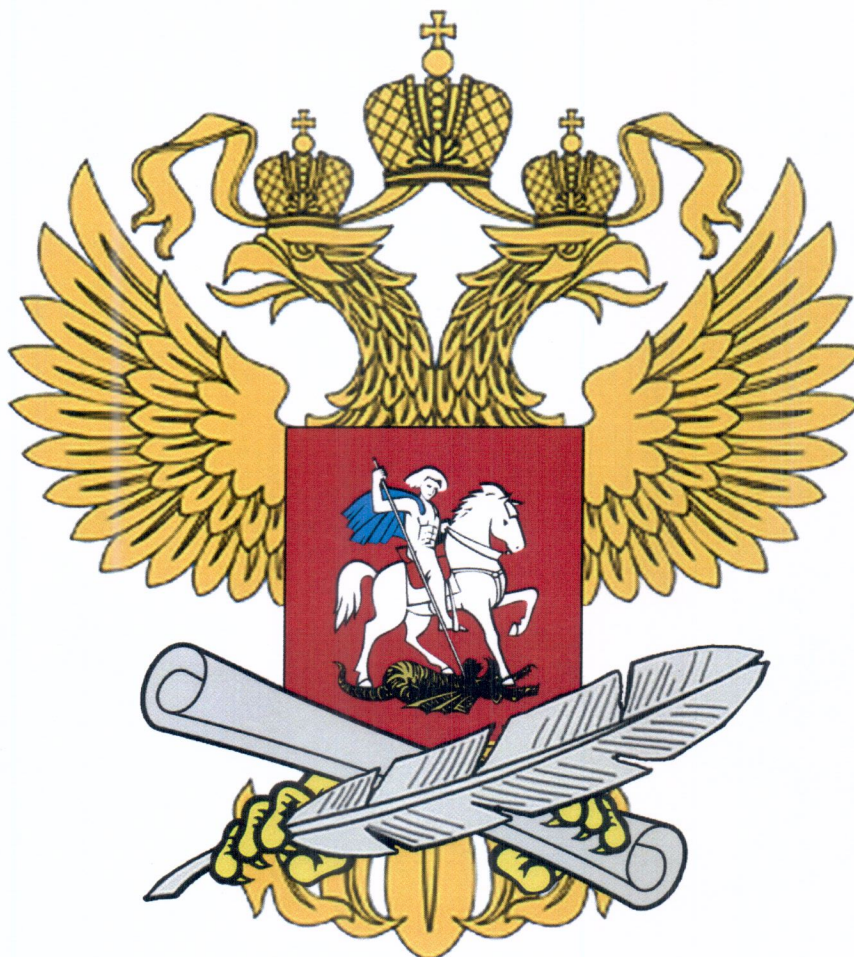
Рисунок геральдического знака – малой эмблемы Министерства образования и науки Российской Федерации